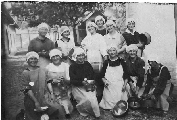
Haushaltungsschule Wiesholz, stehend 1. v. links

Nach meiner Schulzeit habe ich ein Jahr lang in der Papierfabrik Schmid (heute Mitschjeta) gearbeitet. Anschliessend durfte ich einen Halbjahreskurs in der Haushaltungsschule in Wiesholz besuchen.