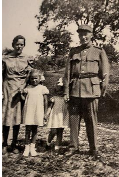
Mutter, Vater auf Heimurlaub und die kleine Schwester