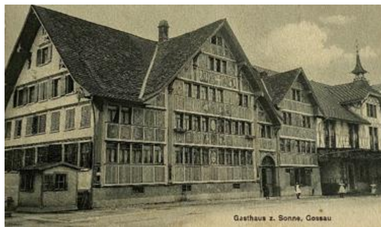
Gasthaus «Sonne», Wohnhaus und rechts die Garage Schärer