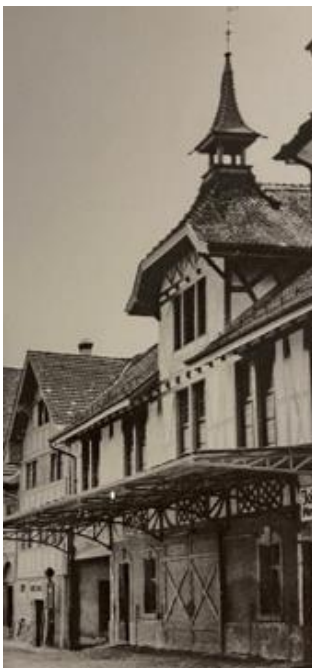
Die ehemaligen Pferdestallungen